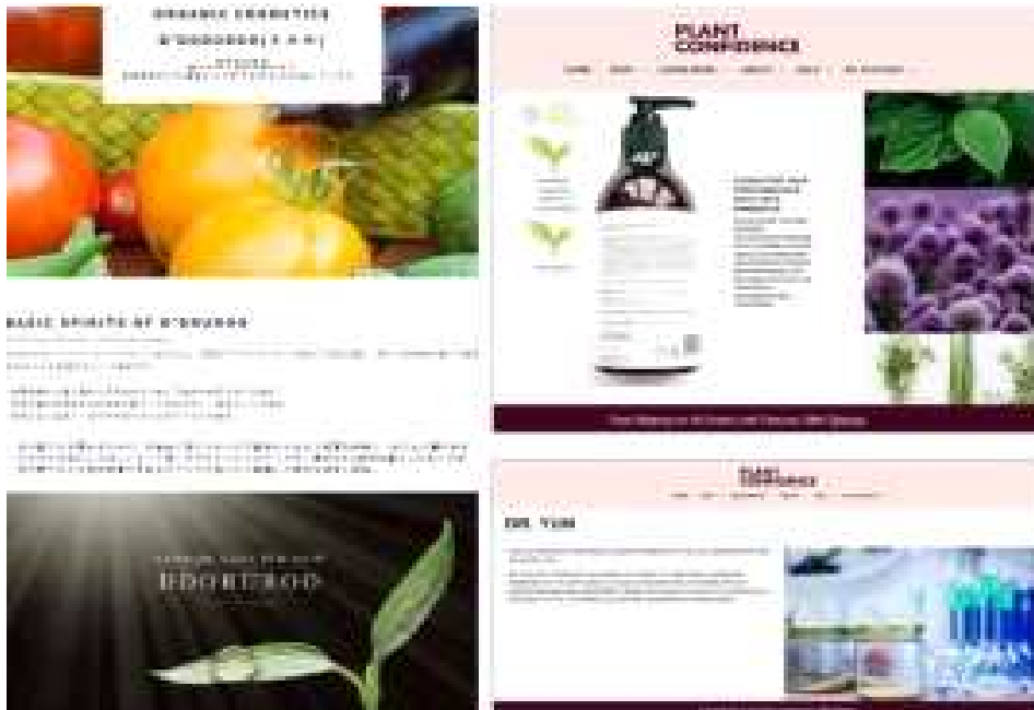
[(주)또르르의 국내외 마케팅 채널, 일본과 미국 홈페이지 및 아마존 물 입점